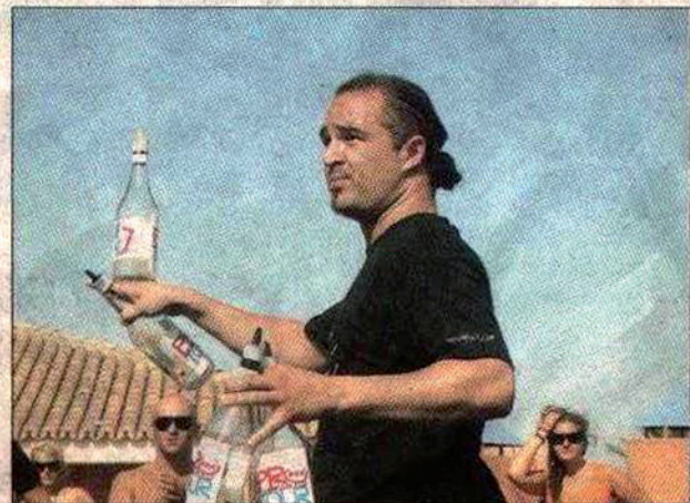
Mostrando una de las modalidades en su especialidad.