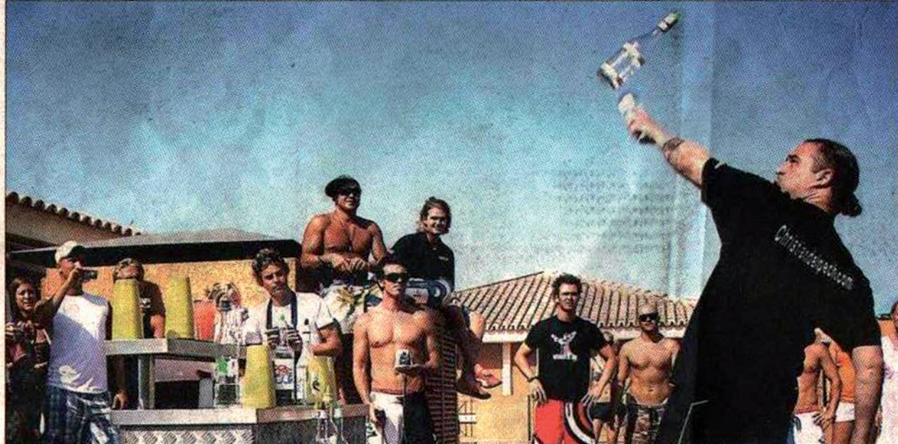
El campeón enseña sus habilidades con las botellas ante los alumnos de la coctelería.