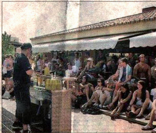
Dejó al público atónito ante sus destrezas.