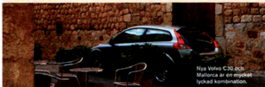
Nya Volvo C30 och Mallorca är en mycket lyckad kombination.