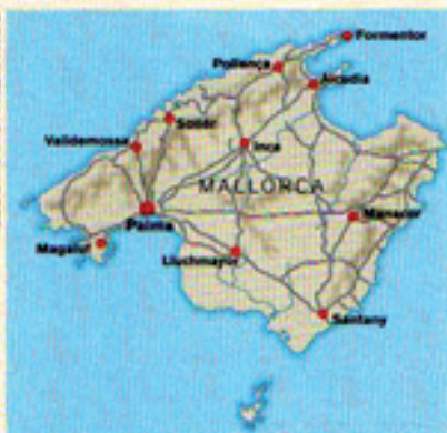
ILLUSTRATION KEN NISS

Mallorca lämpar sig alldeles utmärkt för utflykter med bilen. Snabbfärjan från Barcelona tar drygt tre timmar.